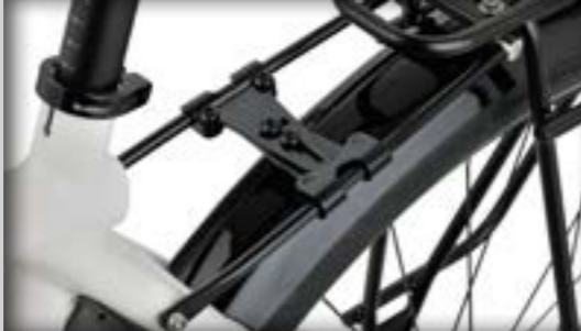
idworx Brace bagagedrager versterking