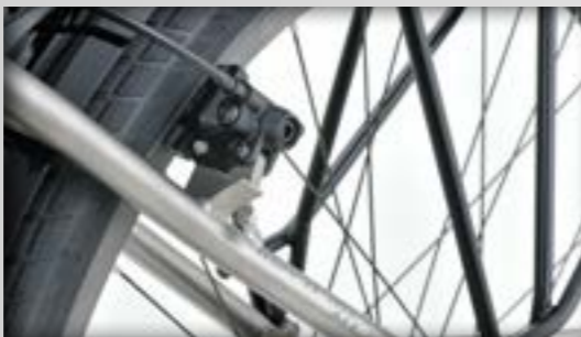
Magura FIRM-tech remmen