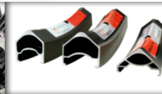
idworx Darim velgen