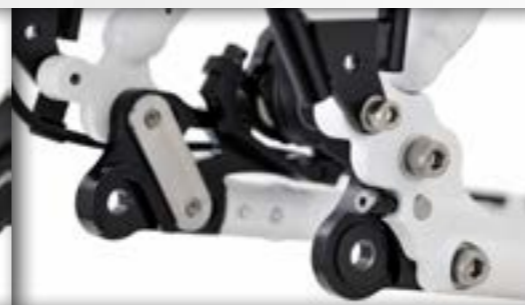
synchron verstelbare uitvaleinden