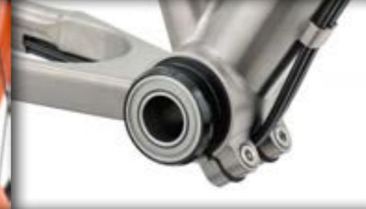
EBB Long Life met speciale kogellagers