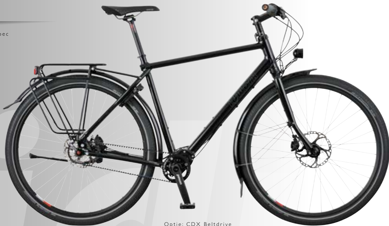
Optie: CDX Beltdrive

Geen compromis maar synergie: de oPinion verenigt het beste van twee werelden. De uitgekende framegeometrie en de sportieve stureigenschappen completeren deze ideale 'all-weather bike'. De onderhoudsvrije Pinion versnellingsbak en de complete, hoogwaardige afmontage kenmerken de ideale alledaagsfiets. Een proefrit kan zomaar jaren duren.