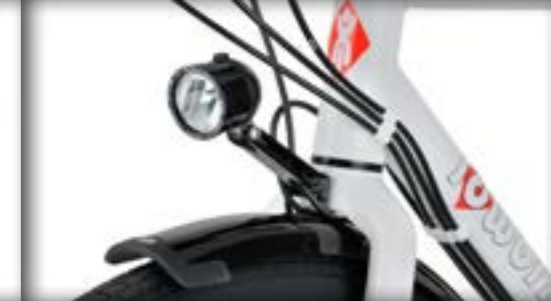
idworx SON Edelux II met CNC lampenhouder