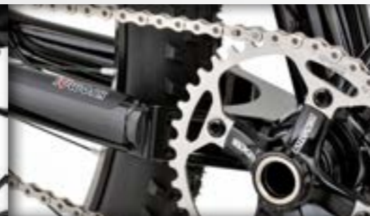
idworx Long Life aandrijving