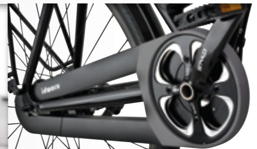
idworx Hesling kettingkast