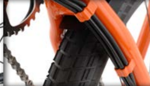
compleet gesloten kabelvoering