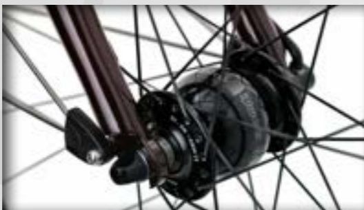
idworx SON 28 Wide Body SL naafdynamo